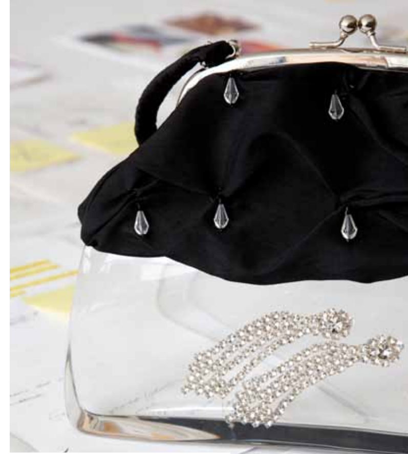
Marilyn Bag (2007). Onder: Trophy Helmet uit de collectie Seven Necessities (2012).

stuk waarvan ik dacht: dít wil ik zeggen. En dat duurde dus tien jaar. Als je van de kunstacademie komt, ben je nog geen kunstenaar. Je kunt kunst niet vergelijken met een aandeelhoudertjesopleiding of een bankiersopleiding. Je hebt als kunstenaar niet een handleiding, zoals een bakker die 500 gram meel en 2 gram zout mengt. Kunst is een intens traject, daar heb je jaren voor nodig.' Binnen een week was de muis verkocht aan een verzamelaarster in Chicago. Een paar jaar geleden is Noten bij haar op bezoek gegaan, met in zijn achterhoofd het idee om de muis terug te kopen. 'Het was mijn eerste mooie ding en voordat ik me realiseerde dat ik er tien jaar naartoe had gewerkt, was het weg.' De eigenaresse van de muis was een eigenzinnige vrouw, met een huis barstensvol kunst. 'Geen rijke tuthola, »